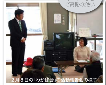
2月8日の「わかば会」の活動報告会の様子