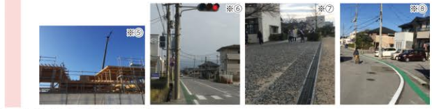
※お困りごと・お気付きのこと。まずはご一報ください。

●積み残した案件の中の、「新市民体育センター建設」・「彦根市図書館構想および拠点図書館整備」・「国体関連の諸事業」・「福祉日本一の達成」や「強い彦根の創造」に関しては、引き続き様々な場面で質疑、提言することにより市民の皆さまが「住んでよかった」「住み続けたい」と思っていただけ彦根市への推進に努める所存でございます。