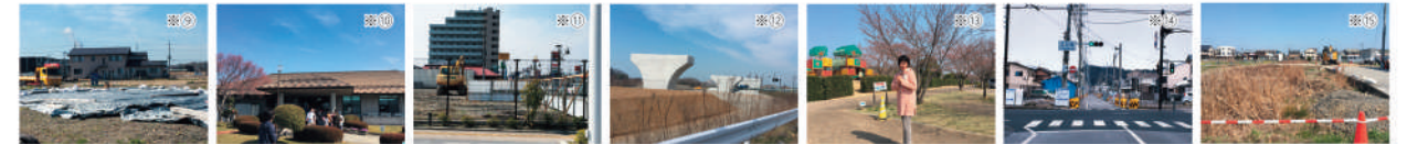
※お困りごと・お気付きのこと。まずはご一報くださいね。