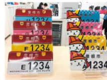
ご当地ナンバープレートの 交付開始