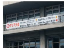
彦根出身の選手たちの 目覚ましい活躍の横断幕