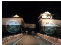
彦根錦秋のライトアップ 「城あかり」