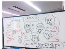
「みんな違って、みんないい」 多文化共生の取組から